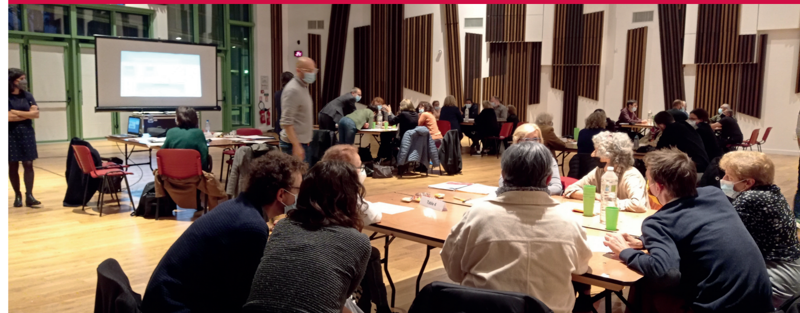
Premier atelier de concertation élargi au Pavillon le 22 octobre 2021

La Ville de Romainville et Est Ensemble ont lancé une démarche forte de co-construction de la phase 2 du projet urbain, pour replacer les habitant-e-s du quartier au centre des décisions. L'enjeu est de repartir des besoins et souhaits de ces habitant-e-s concernant leur logement et leur quartier afin de bâtir un projet permettant d'y répondre.