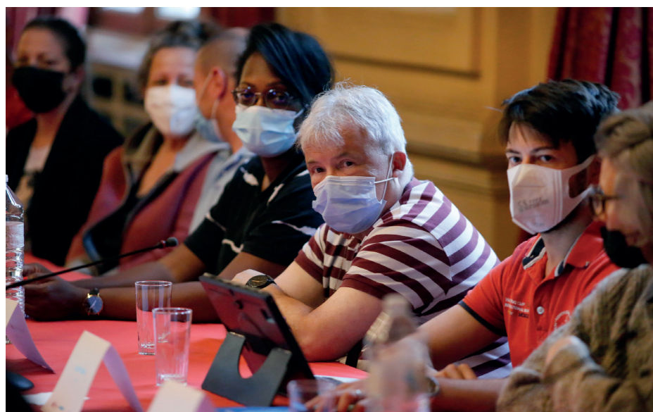
Réunion d'installation du COPIL citoyen le 12 juillet 2021.