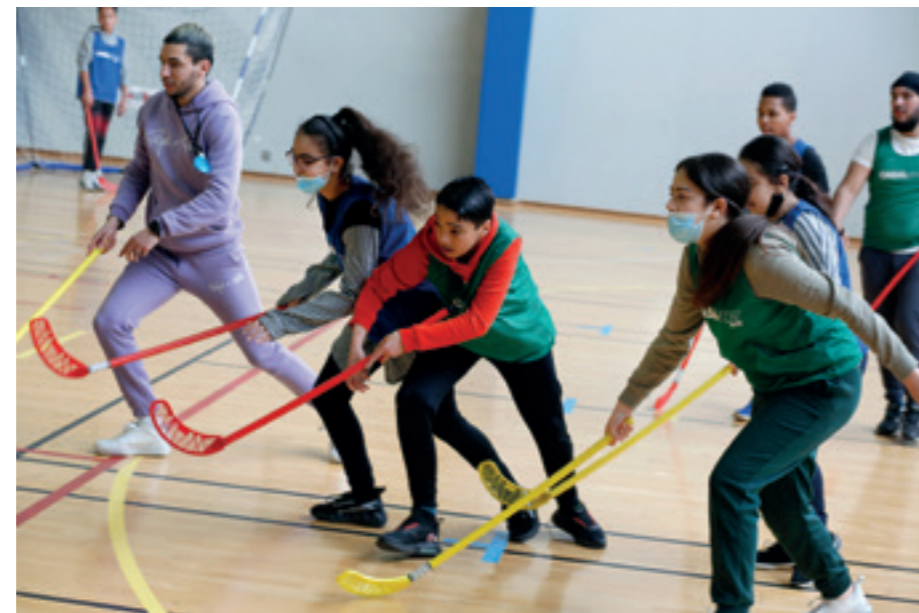
■ Durant les vacances d'hiver 2022, de nombreuses activités sportives ont été proposées dans les complexes sportifs à l'attention des enfants, des jeunes, et des familles de Romainville inscrites aux activités des centres de loisirs et des Espaces de proximité.