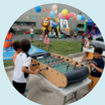
726 K€ - Romainville l'été