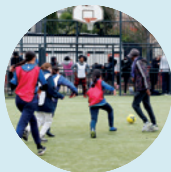
348 K€ - Amélioration des équipements sportifs et acquisition de matériel