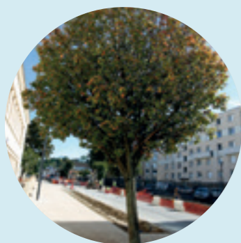
1,55 M€ - Réfection et végétalisation de la rue des Chantaloups