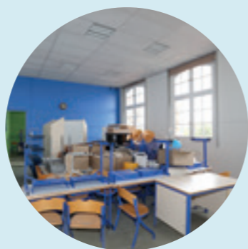
950 K€ - Travaux de rénovation et d'amélioration de l'ensemble des écoles