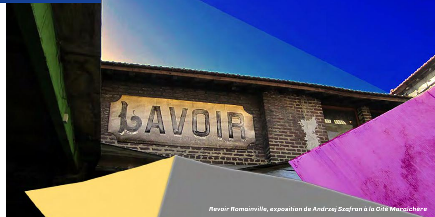
Revoir Romainville, exposition de Andrzej Szafran à la Cité Maraîchère