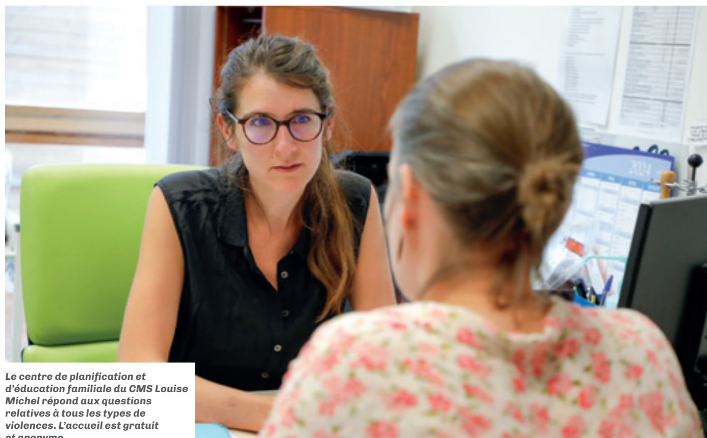
Le centre de planification et d'éducation familiale du CMS Louise Michel répond aux questions relatives à tous les types de violences. L'accueil est gratuit et anonyme.

Le centre de planification et d'éducation familiale (CEPF), installé au Centre municipal de Santé (CMS) Louise Michel, répond aux questions relatives à tous les types de violences. L'accueil est gratuit, anonyme, sans restriction d'âge et de situation familiale. Le centre social