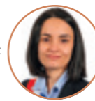
Samira AÏT BENNOUR Première Maire-adjointe Égalité territoriale Démocratie participative Habitat Salubrité publique