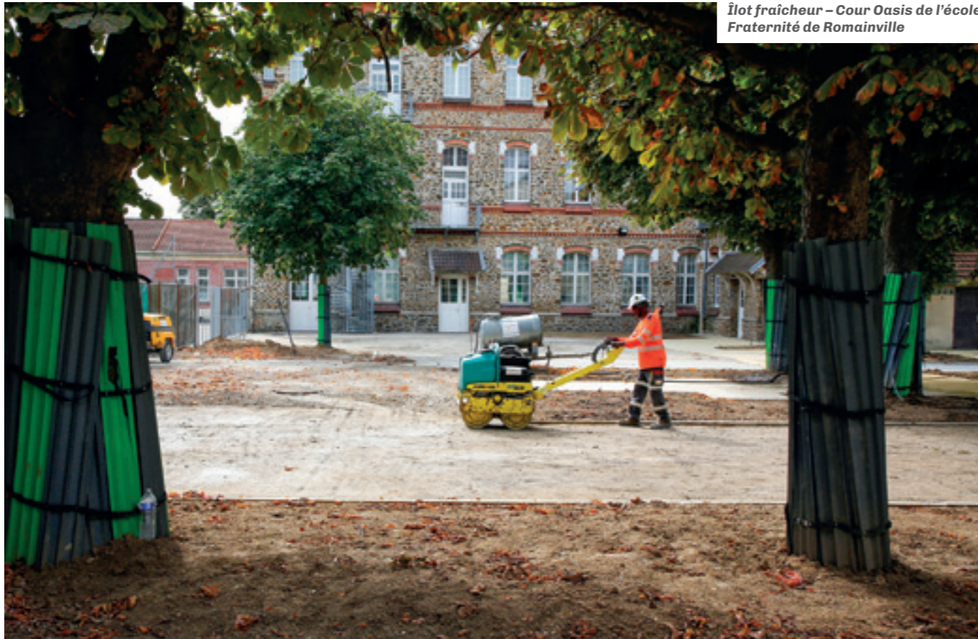
Îlot fraîcheur – Cour Oasis de l'école Fraternité de Romainville