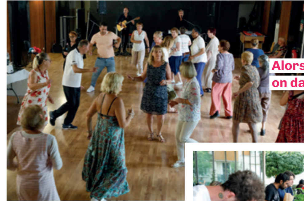
Alors on danse!

Lundi 22 juillet: entre tango, paso doble et madison, les sénior-e-s ont apprécié les thés dansants de juillet et août. Centre social Cachin.