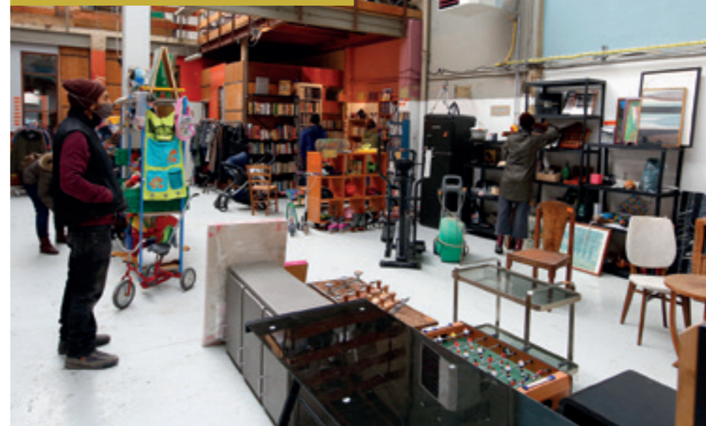
Portes ouvertes de la Ressourcerie-Fabricothèque le 22 octobre 2020.