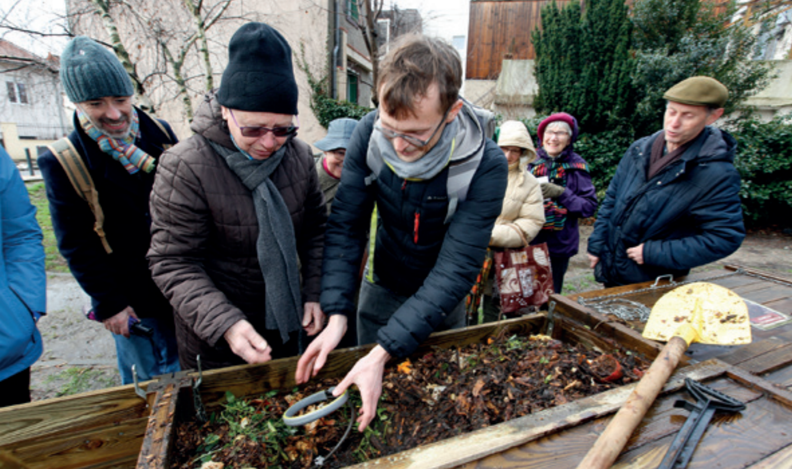
Sensibilisation au compostage avenue Henri-Barbusse.