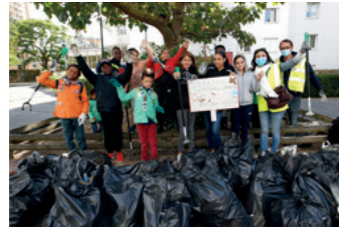
■ Collecte conséquente dans les rues et espaces verts du quartier pour l'équipe de bénévoles de la place André-Léonet aux Bas-Pays.

Le samedi 26 septembre, dans le cadre de la Semaine européenne du développement durable, les habitant-e-s ont été invité-e-s à participer à l'opération " Nettoyons la nature ". 260 kilos de déchets ont ainsi été collectés sur quatre lieux de Romainville lors de cette action citoyenne et intergénérationnelle menée avec les associations Ball et Scouts et Guides de France.