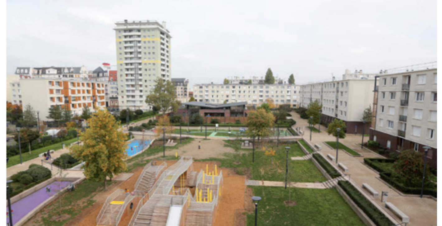
Plaine centrale au cœur la cité Marcel-Cachin.

À la rentrée, on comptait d'ailleurs 343 familles inscrites à ces activités sportives, culturelles et de loisirs. Cependant, plus de 130 autres familles ont dû être mises sur liste d'attente.