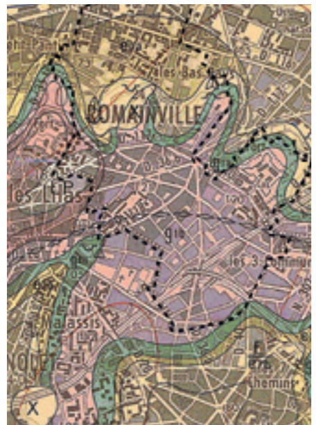
Extrait de la carte géologique de Romainville

À terme, cette étude paysagère aidera à mettre en place une gestion écologique des espaces de nature par les services de la Ville ; trouver un équilibre entre le renforcement de la biodiversité et l'accessibilité des espaces verts pour les habitant-e-s et peut-être même obtenir des labels reconnus pour la biodiversité comme celui du « Territoire engagé pour la Nature de l'Office National de la Biodiversité ».