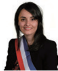
Samira AÏT BENNOUR Première Maire-adjointe Égalité territoriale Démocratie participative Habitat Salubrité publique