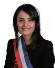
Samira AÏT BENNOUR Première Maire-adjointe Égalité territoriale Démocratie participative Habitat Salubrité publique