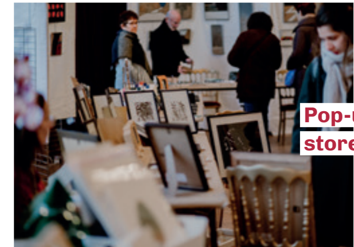
Pop-up store arty