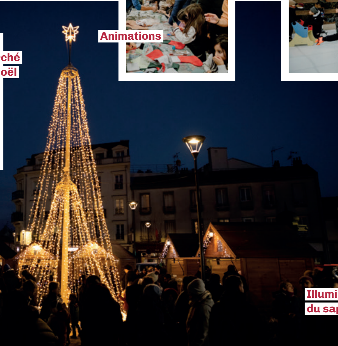
Illumination du sapin