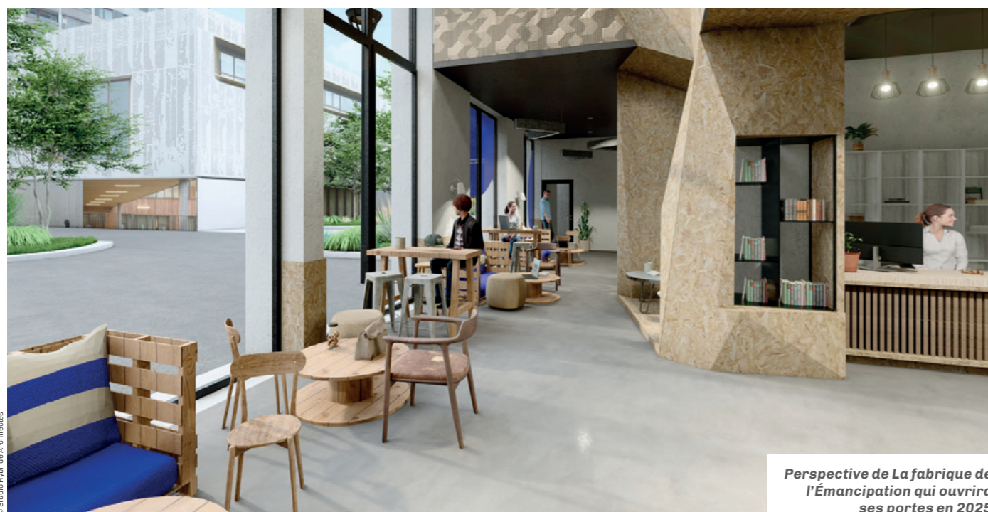
Perspective de La fabrique de l'Émancipation qui ouvrira ses portes en 2025

La Fabrique de l'Émancipation sera un lieu d'innovation, un espace de ressources et d'accompagnement de proximité, évolutif, adapté aux besoins des Romainvilloises et Romainvillois