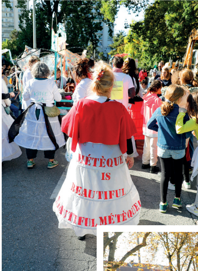
Parade haute en couleurs!