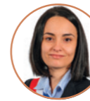
Samira AÏT BENNOUR Première Maire-adjointe Égalité territoriale Démocratie participative Habitat Salubrité publique