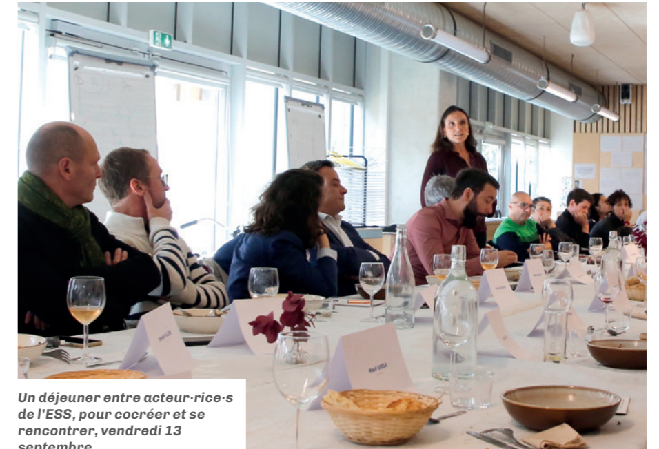
Un déjeuner entre acteur-rice-s de l'ESS, pour cocréer et se rencontrer, vendredi 13 septembre.

En 2022, les Villes de Noisy-le-Sec, de Romainville et Est Ensemble, en partenariat avec le propriétaire foncier, l'EPF Île-de-France, lancent un appel à can-