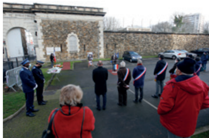
■ La cérémonie s'est poursuivie aux Lilas par des allocutions, dépôts de gerbes fleuries et instants de recueillement à l'entrée du Fort de Romainville.