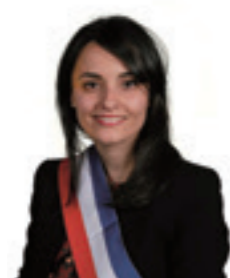
Samira AÏT BENNOUR Première Maire-adjointe Égalité territoriale Démocratie participative Habitat Salubrité publique