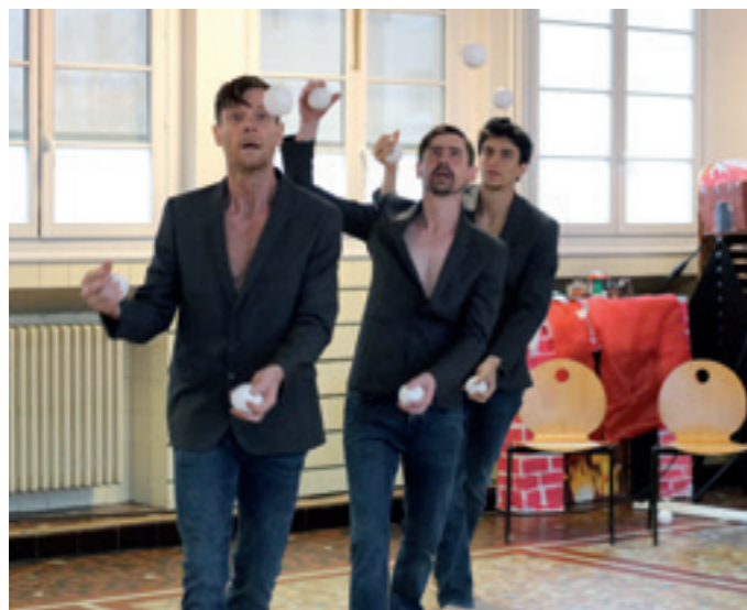
■ Le spectacle de jonglage Matières Pré-Évolutives a été donné par la Compagnie Nushka à l'école élémentaire Langevin-Wallon, le mercredi 27 janvier. Une seconde représentation a eu lieu, au centre de loisirs Marcel-Cachin.

Le dimanche 24 janvier, les Villes de Romainville et des Lilas ont commémoré le 78 e anniversaire du départ du convoi de femmes déportées, dit des "31000", pour les camps d'Auschwitz et de Birkenau.