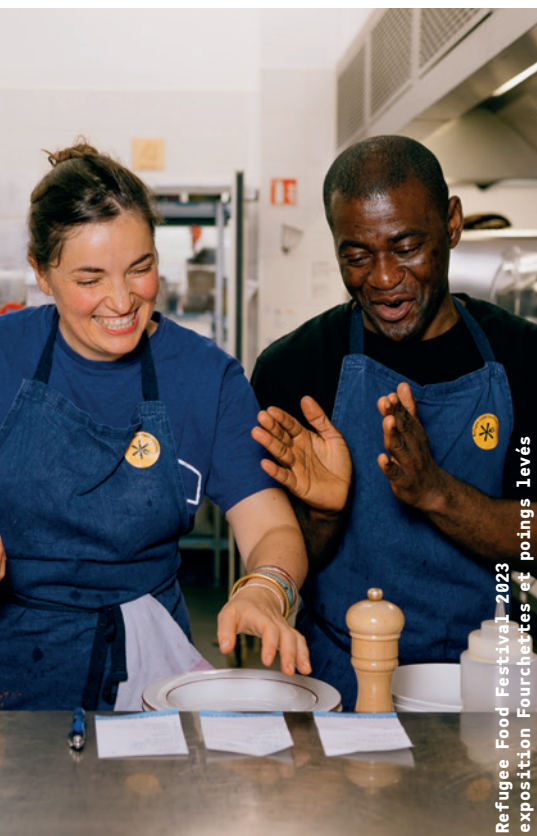
Refugee Food Festival 2023 exposition Fourchettes et poings levés

Le temps d'un brunch, Les Cheffes ouvrent leur cuisine à un chef réfugié du réseau Refugee Food pour un moment de rencontres et de fusions culinaires. Une occasion de découvrir une cuisine différente et inédite, d'ici et d'ailleurs !