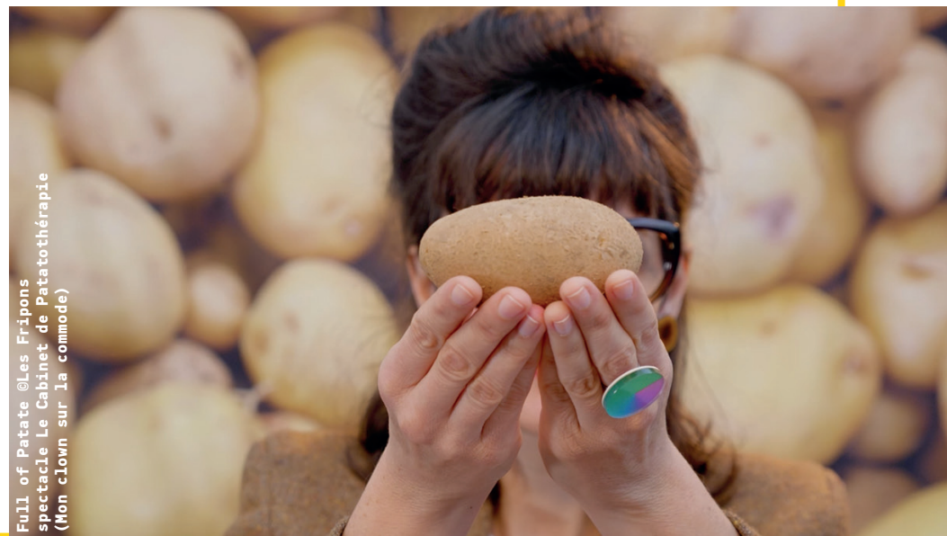
Full of Patate @Les Fripons spectacle Le Cabinet de Patatothérapie (Mon clown sur la comode)