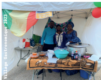
Village Gastronomique 2023

Et si l'art de découvrir l'autre et de se rassembler par-delà nos différences passait par le plaisir originel, universel et partagé des arts de la table ? Les saveurs du monde : des cuisines qui rassemblent ! Troisième édition d'une journée festive et gustative organisée par AJIR et les habitant·e·s du quartier Marcel Cachin.